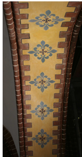
Ansichten einer Emporenbogenlaibung während der Bearbeitung