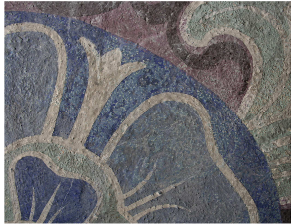
Detailansicht zu Retuschen an einer Lutherrose auf der Nordarkade

Teile dieser Malereien in der Vorkirche, an der Orgelarkade und den Seitenemporen wurden im