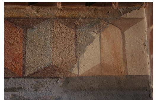
Detailansichten zur Restaurierung der Malereien auf der Nordarkade