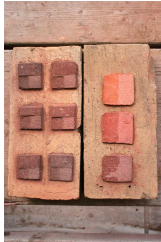
Probeflächen zur Mörtelanpassung