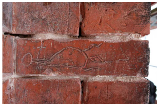
Fassadenziegel mit figürlicher Ritzung