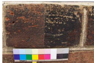
Probefläche zur Ziegelreinigung