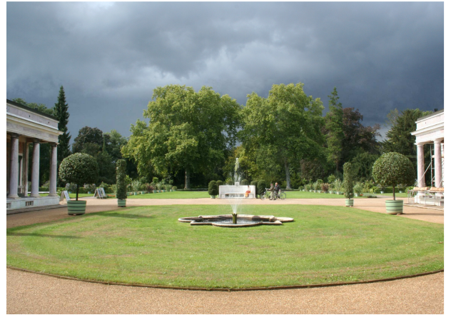
Ehrenhof des Potsdamer Marmorpalais