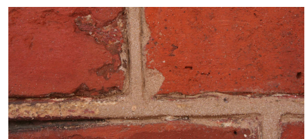
Ziegelkittungen & Fugenkonservierung