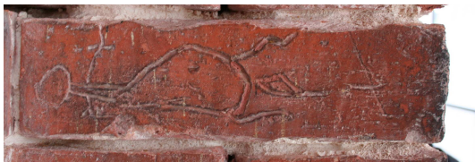
Fassadenziegel mit figürlicher Ritzung

AUFTRAGGEBER: Stiftung Preußische Schlösser und Gärten