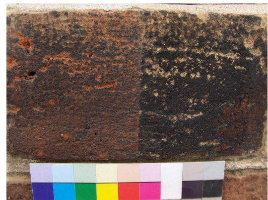
Probefläche zur Ziegelreinigung