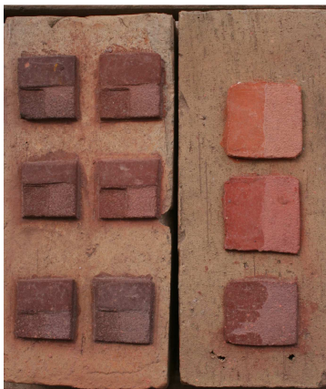
Probeflächen zur Mörtelanpassung