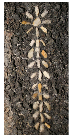
Detail eines Grottierungsornaments