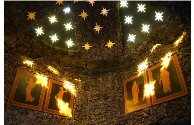
Endzustand der restaurierten Innenraumgrottierung mit reapiplizierten Zinkblechtafeln und vergoldeten Sternen in der Kuppel