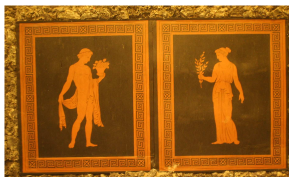
Endzustand von 2 restaurierten und neu versetzten Zinkplatten