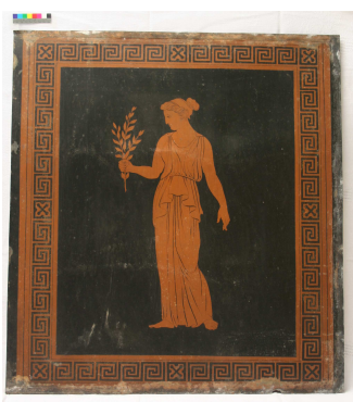
Vorzustand einer Zinkplatte