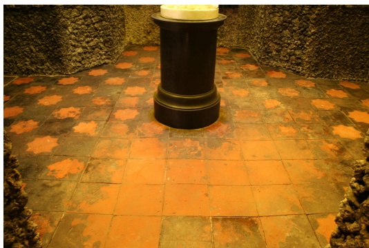
Detailansicht des restaurierten Terrakottafußbodens