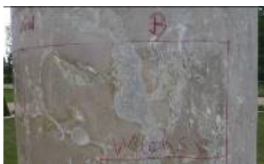
Anlegen von Musterflächen