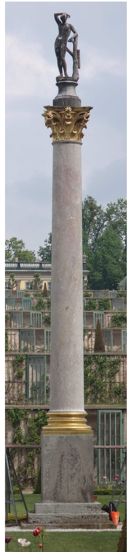
Ansicht der Nordostsäule