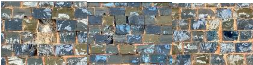
Vorzustand Detailansicht Schadstelle Mosaik