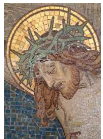
Detailansichten zur Bearbeitung einer Fehlstelle am Kopf der Christusfigur