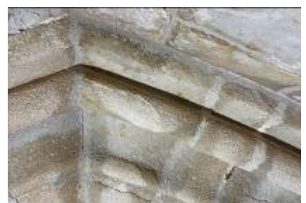
Bearbeitung von Werksteinfugen an einem Gurtbogen im südlichen Seitenschiff