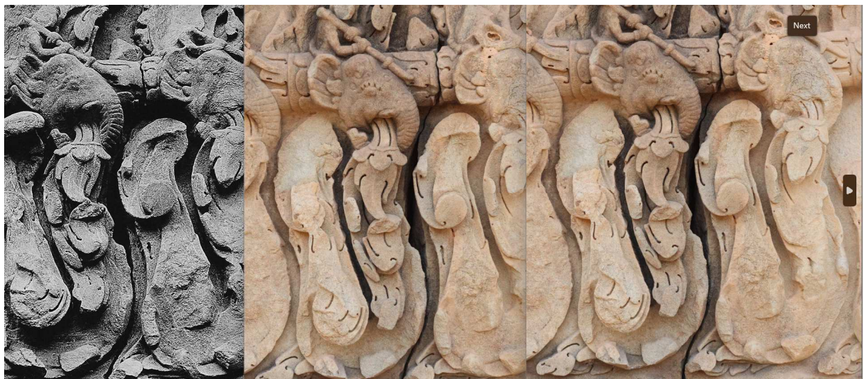
Evaluierung der Fotodokumentation zum Erhaltungszustand eines Lintals über den Verlauf von knapp 90 Jahren