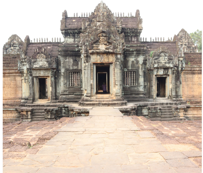
Ansicht des Tempels Banteay Samre, östliches Zugangstor