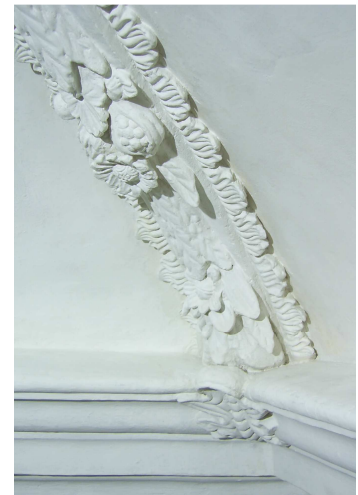
Detailansicht einer Stuckrahmung des Deckenspiegels während der Stuckrestaurierung und der Ausführung einer Neufassung