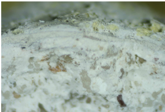
Mikroskopprobe zur Fassungsabfolge der Decke

Die barocke Stuckdecke der Dorfkirche Groß Glienicke wurde als erster Abschnitt der Innenrauminstandsetzung im Herbst 2006 restauriert. Nach der Sanierung des hölzernen Deckengewölbes konnten vorhandene Putzfehlstellen geschlossen und gefährdete Stuckbereiche neu versetzt und ergänzt werden. Die Neufassung der Decke erfolgte in Rekonstruktion der barocken Farbgebung.