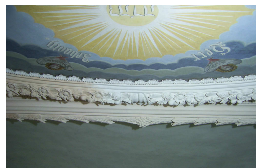
Deckenbildrahmung während der Neufassung